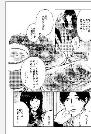
漫画を転載 アイテム紹介