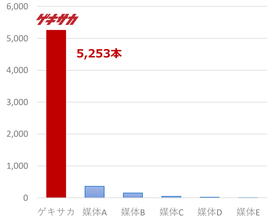
主要サッカー総合メディア 高校カテゴリー記事総数(2022年)