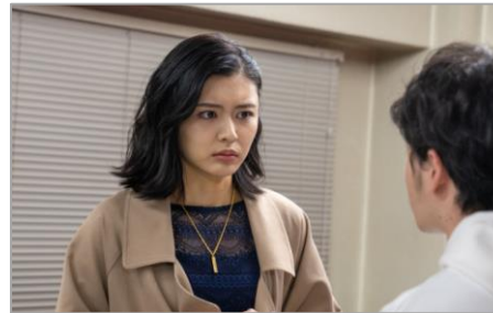
「スイートリベンジ」