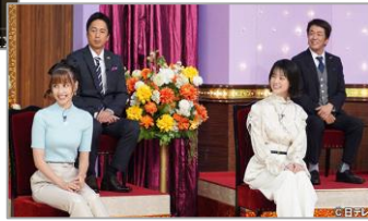
NTV「しゃべくり007」今年ブレイク間違いなし！ネクストブレイク美女SP

■引用： https://ent.smt.docomo.ne.jp/article/12184562