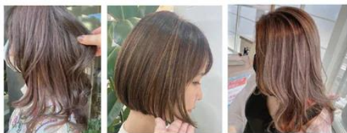
by CLEAR OF HAIR by massage by GSHAMA WORLD