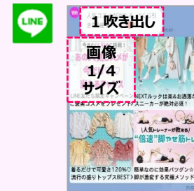
ViVi公式LINE 1吹き出し+1/4画像 投稿1回