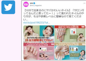
ViVi公式 Twitterカスタマイズ投稿1回