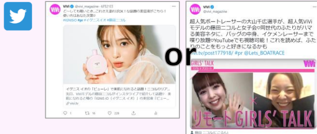
ViVi公式Twitter記事誘導投稿1回 ※本メニュー単独発注の場合は、テキスト+画像投稿1回