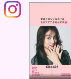
ViVi公式 Instagramストーリーズ投稿1回