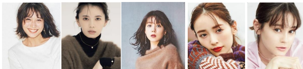
広瀬アリス 宮田聡子 トリンドル玲奈 泉里香 emma