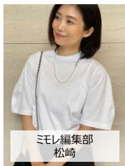
ミモレ編集部 松崎