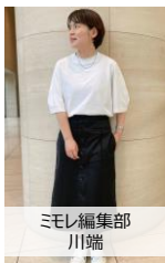
ミモレ編集部 川端