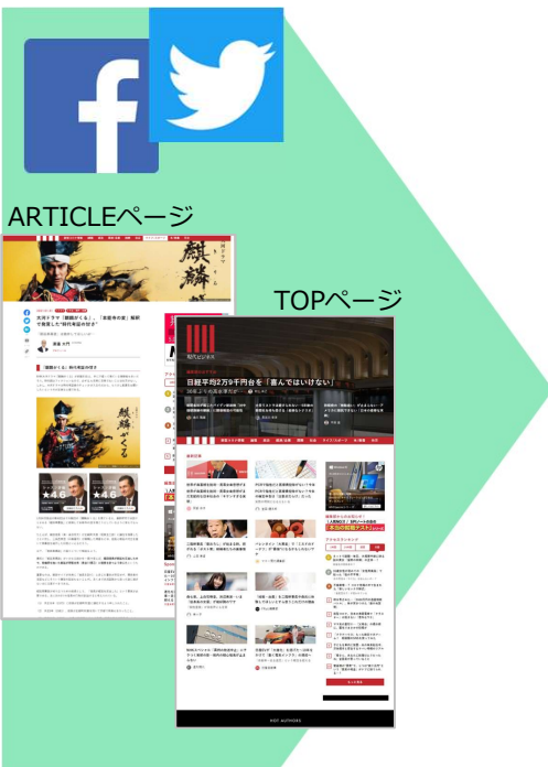
現代ビジネスアカウントSNS