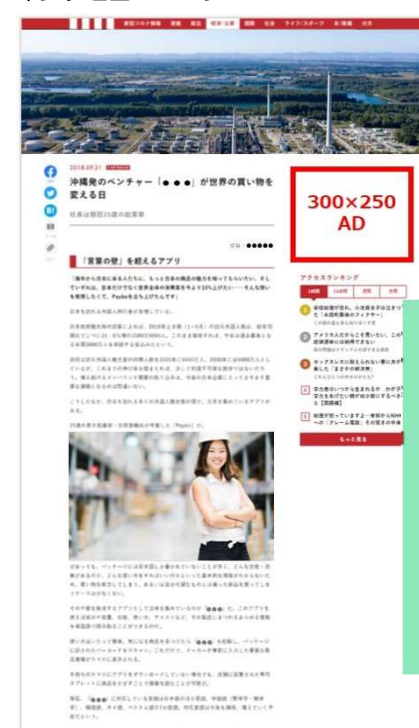
インタビューページ