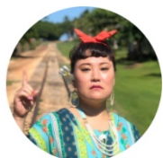
芸人 バービーさん