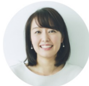
フリーアナウンサー 中村 仁美さん