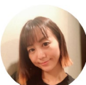
タレント 福田 萌さん