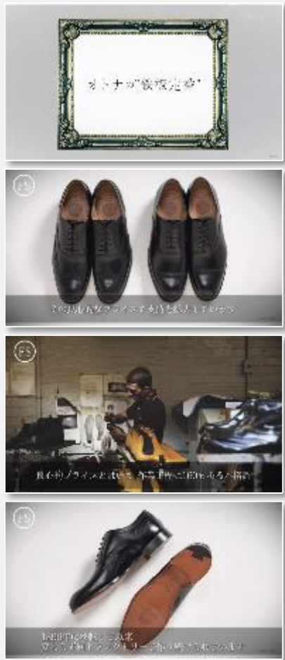
【「鉄板定番」動画 イメージ】