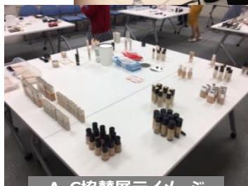
A・C協賛展示イメージ