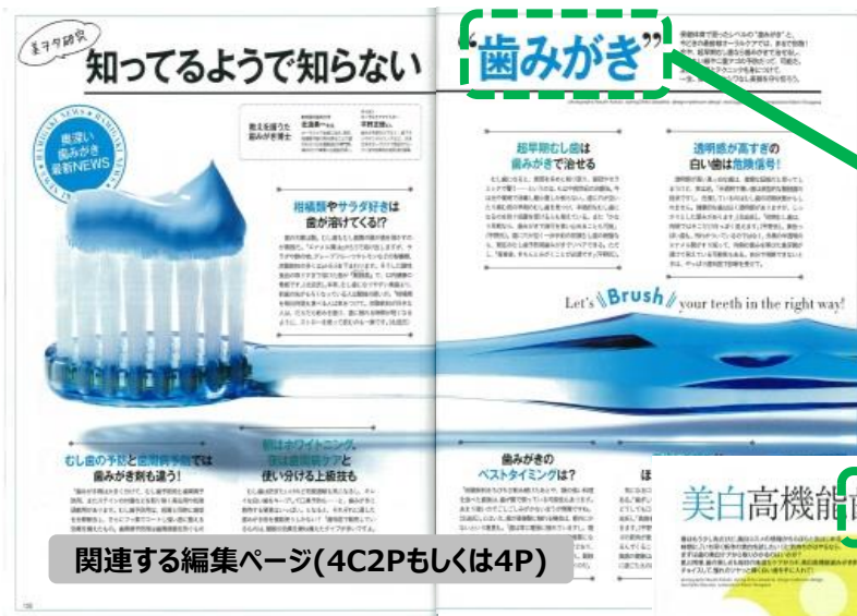
関連する編集ページ(4C2Pもしくは4P)

「歯みがき」という切り口で編集ページを制作。「歯磨き粉」のタイアップで連動しました