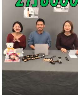
2019年2月6日放送 ローラメルシエ様