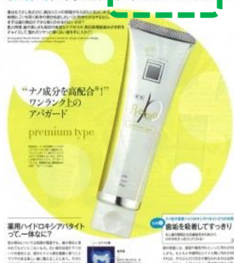
関連するタイアップページ(4C2Pもしくは4P)